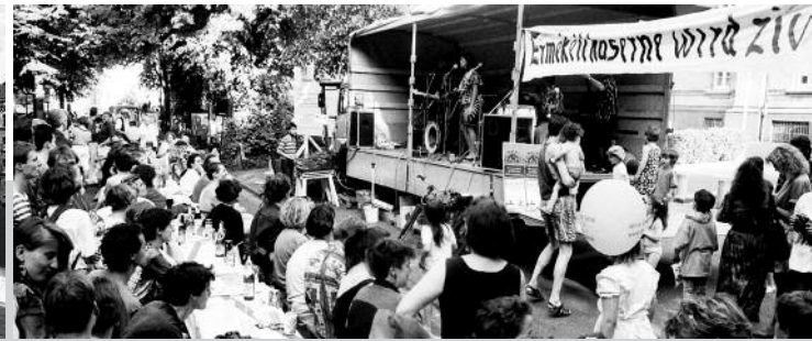
15. Mai 1992