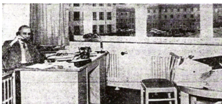
Bürodirektor Börner: „Von der Baracke zum bunten Haus“

12. November 1955 Die Halle wird hergerichtet für die Feier zur Vereidigung der ersten Generäle und 101 Soldaten der neugegründeten Bundeswehr.